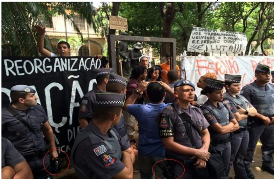
Policiais em frente a colégio em Pinheiros

Outros relatos da escola Fernão Dias contam que PM fez tortura psicológica com estudantes durante a madrugada, como por exemplo ameaçava os alunos: " nos vemos aí dentro no dia da reintegração ". Além disso, tiveram abusos das prerrogativas dos advogados, que foram impedidos diversas vezes, pela PM, de conversar com estudantes que solicitavam assessoria jurídica. Também nessa escola, o Conselho Tutelar passou indevidamente o nome dos ocupantes para a PM e negou pedido dos estudantes que solicitaram advogado para acompanhar no carro do Conselho até audiência de conciliação no Fórum da Fazenda Pública no dia 13 de novembro.