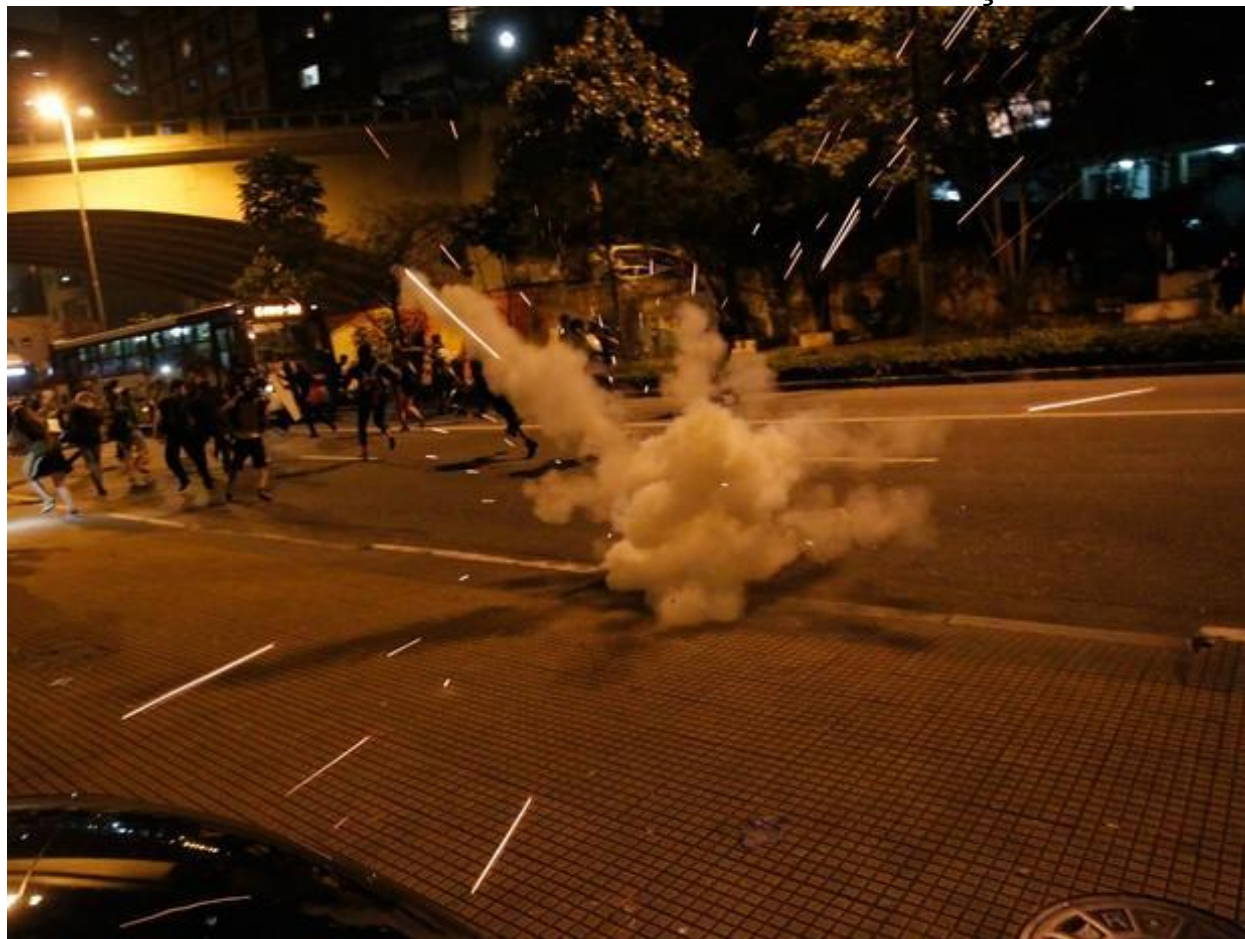
PM usa bomba em protesto de estudantes na Av. 9 de Julho em SP

Os dois adolescentes detidos respondem por desacato e resistência. Eles disseram que foram abordados por policiais militares enquanto recolhiam as cadeiras que usaram na manifestação para levarem de volta para a escola. “Eles bateram com o cassetete no meu braço, aí eu caí no chão e eles me arrastaram. Na hora que eu levantei para poder me levarem para o camburão, colocaram o cassetete no meu pescoço e começaram a enforçar e levar”, disse um dos adolescentes.