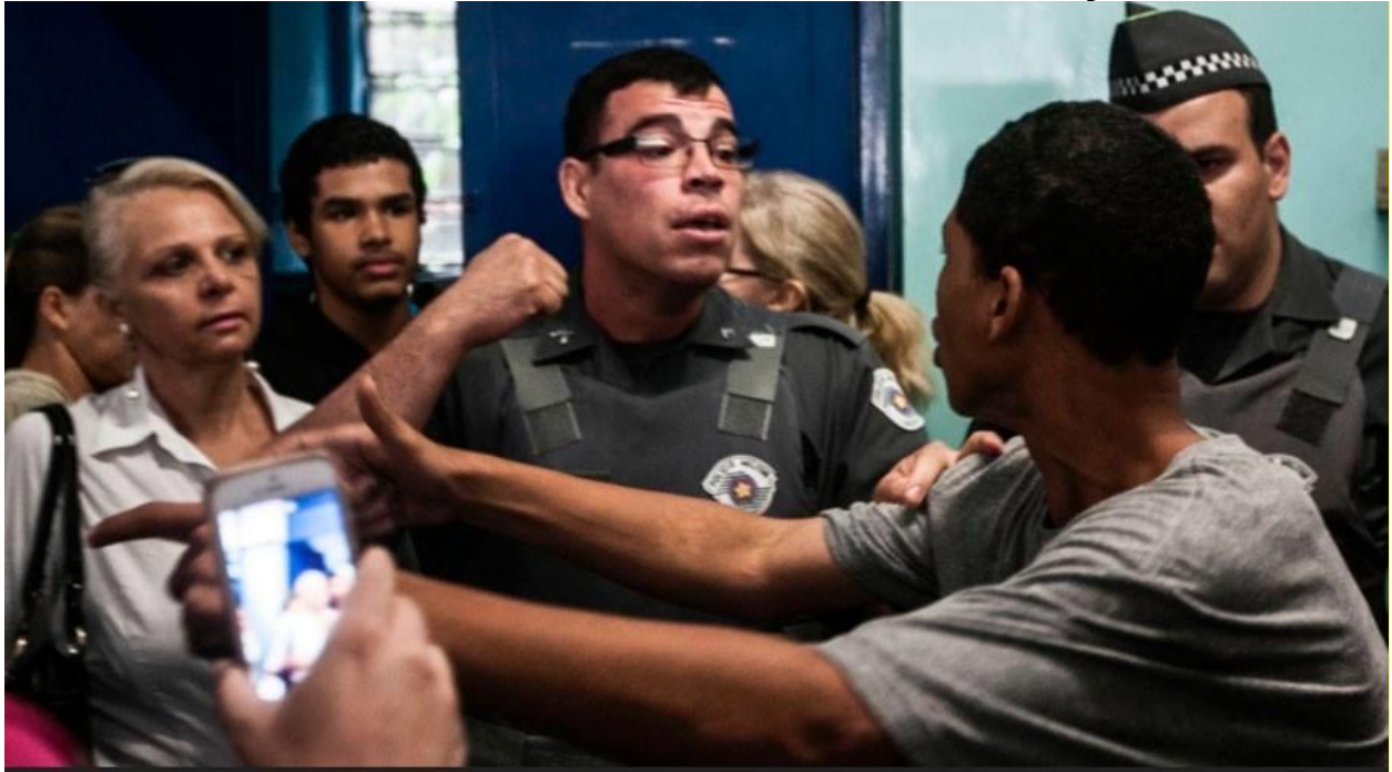
Falta de identificação policial durante invasão do colégio Maria José pela PM.