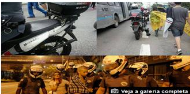
Policiais sem identificação e placa atuam em protestos em SP

Durante os protestos contra o fechamento de escolas no Estado de São Paulo, policiais militares entraram em confronto com estudantes que se manifestavam nas ruas. Em algumas situações, os agentes pareceram sem as tarjetas de identificação e com moto sem placa em local visível.